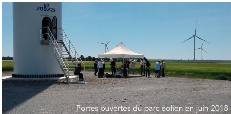
Portes ouvertes du parc éolien en juin 2018

Au vu de l'effort de prospection, du nombre de données brutes récoltées et aux études réalisées précédemment, nous pouvons conclure à une mortalité faible pour les oiseaux et modérée pour les chauves-souris d'après notre échelle de détermination.